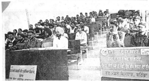
ਐੱਮਆਰਐੱਸਪੀਟੀਯੂ ਵਿਖੇ ਲਾਏ ਇਕ ਰੋਜ਼ਾ ਜੰਗਲਾਤ ਜਾਗਰੂਕਤਾ ਕੈਂਪ 'ਚ ਸ਼ਾਮਲ ਵਿਦਿਆਰਥੀ। ਪੰਜਾਬੀ ਜਾਗਰਣ