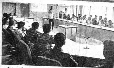
ਸਾਈਬਰ ਸੁਰੱਖਿਆ ਸਬੰਧੀ ਜਾਣਕਾਰੀ ਦਿੰਦੇ ਹੋਏ ਮਾਹਿਰ। ਪੰਜਾਬੀ ਜਾਗਰਣ