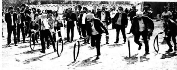
महाराजा रंजीत सिंह पंजाब टेक्निकल यूनिवर्सिटी की एलुमनी मीट में रोमांचक खेल मुकाबले में भाग लेते पुराने विद्यार्थी।