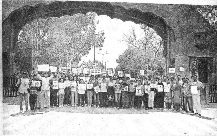
ਵਾਤਾਵਰਨ ਦੇ ਮੁੱਦਿਆਂ ਬਾਰੇ ਜਾਗਰੂਕਤਾ ਫੈਲਾਉਂਦੇ ਹੋਏ ਵਿਦਿਆਰਥੀ।